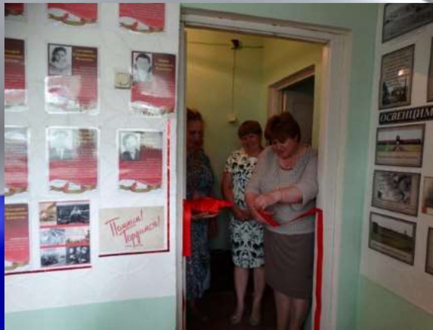
В июне 2017 года состоялось открытие музейного зала № 2 «Зал Боевой Славы»